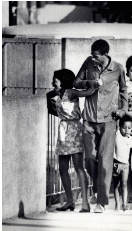
Moradora se despedindo da antiga casa, c. 1970.

A imagem acima mostra o momento em que os últimos moradores carregam os caminhões com seus móveis. Ao fundo, a imagem da Pedra da Gávea e de alguns prédios que fazem parte do Alto Leblon. Dentro da favela, vê-se ainda algumas crianças brincando, enquanto os adultos carregam o caminhão.