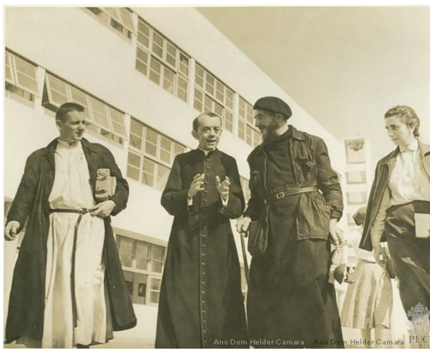
Dom Helder e o Abbé Pierre durante a construção da Cruzada São Sebastião, c. 1955.

Foi durante o 36º Congresso Eucarístico Internacional realizado em julho de 1955, que o projeto do conjunto habitacional da Cruzada São Sebastião nasceu. Dom Helder pretendia, a partir deste projeto, dar início a um plano que visava urbanizar, em no máximo 10 anos, todas as favelas do Rio de Janeiro.