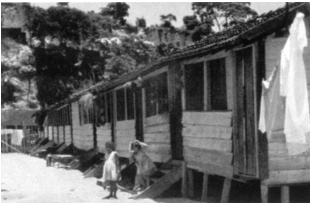
Pátio interno do Parque Proletário da Gávea c. 1950.

“Entre 1941 e 1943, foram construídos três parques proletários ( na Gávea, no Leblon e no Caju) para onde se transferiu cerca de 4 mil pessoas, com promessa de que poderiam retornar para áreas próximas daquelas que viviam (...) ao contrário do prometido, os moradores acabaram permanecendo muito tempo nesses parques (...), deles saindo somente bem mais tarde, expulsos, quando da valorização imobiliária dos respectivos bairros, particularmente os dois primeiros.” 40