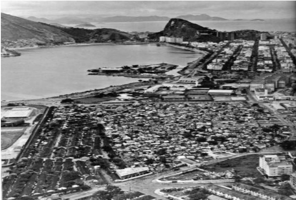
Vista aérea da favela da Praia do Pinto, da Lagoa Rodrigo de Freitas e dos bairros do Leblon e Ipanema. c. 1960.

Nesta segunda fotografia é possível verificar o crescimento dos bairros da Lagoa e do Leblon, e a favela da Praia do Pinto, que ocupa o centro da imagem e contrasta com o espelho d'água da Lagoa Rodrigo de Freitas aparece espremida diante da chegada dos novos vizinhos.