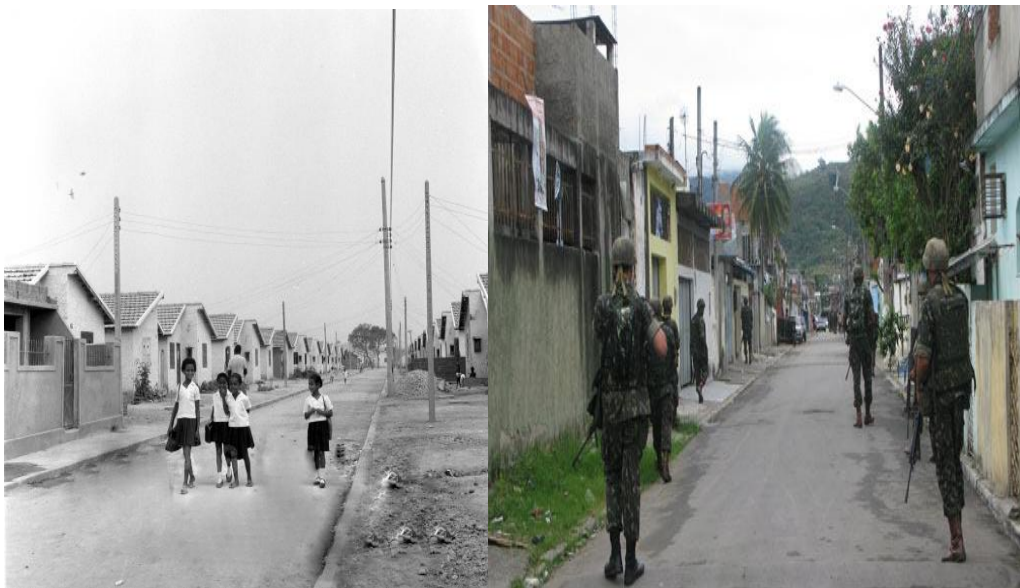
Crianças moradoras do conjunto habitacional Vila Aliança, c. 1960. E operação do Exército em 2011.

Além disso, o governo ao construir os conjuntos priorizou apenas as moradias, mas esqueceu o entorno, ao se mudarem os moradores se depararam com a falta de infra-estrutura dos bairros: não havia asfaltamento, escola com matrículas suficientes para todas as crianças, atendimento médico ou transporte público. Essa realidade fez com que os moradores se unissem em associações para lutarem por seus direitos.