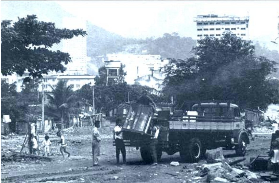
Remoção dos últimos moradores da favela da Praia do Pinto em 1969. Publicado no livro da Secretaria de Administração do Estado da Guanabara. Estado da Guanabara, 1969.

Essa imagem faz parte de um conjunto de fotografias, produzidas para serem publicadas em um livro da secretaria de jornalismo do governo do Estado da Guanabara. O livro registra o momento da remoção dos moradores, incluídas todas as atitudes tomadas para que essa remoção fosse realizada, da vacinação ao cadastramento de cada um dos moradores. O livro também traz um levantamento dos projetos realizados para resolver o problema das favelas do Rio de Janeiro.