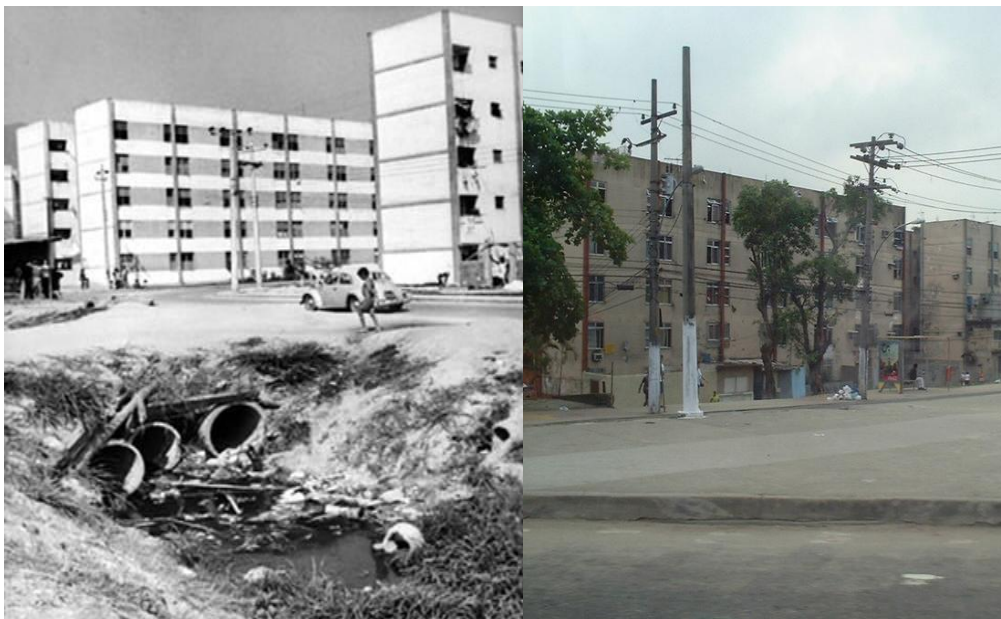
Conjunto habitacional Cidade de Deus, c. 1970 e 2011. Disponível no site da Revista de Geografia y Ciencias Sociales da Universidad de Barcelona.

Nos dias atuais, o tráfico se aprimorou e passou a controlar a venda de botijões de gás e transportes alternativos, entre outros serviços. Além dos traficantes, surgiram também as milícias, grupo de ex-policiais fortemente armados, que cobram altos valores a moradores e comerciantes em trocas de uma falsa segurança, pois o perigo são eles mesmos.