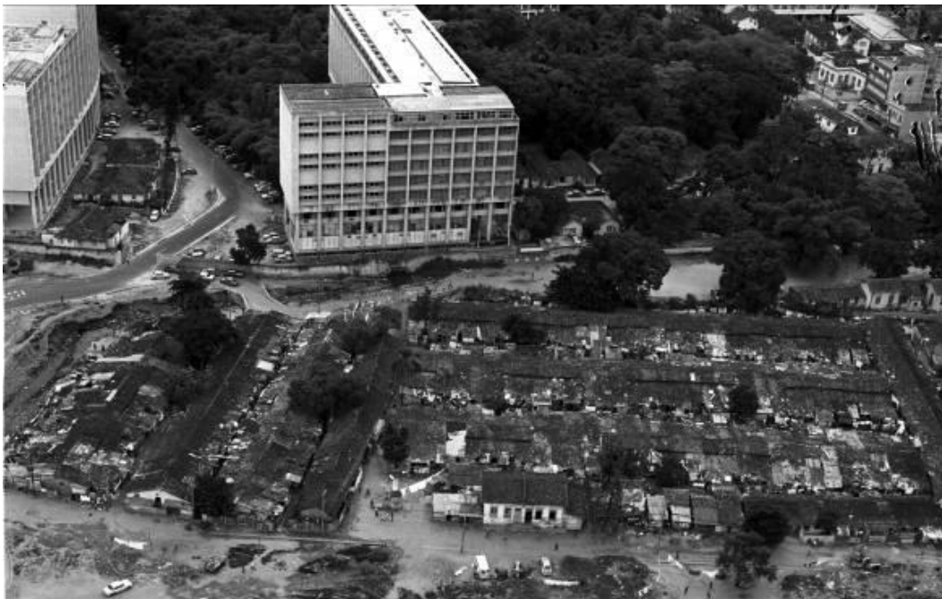
Vista aérea do Parque Proletário da Gávea, c. 1960, com a PUC-Rio ao fundo.

No canto superior direito observa-se parte da Rua Marquês de São Vicente, e é possível ver a ainda existente Escola Municipal Luiz Delfino. Inaugurado em 1873, é considerada a segunda edificação mais antiga do Rio de Janeiro destinada a uma escola pública. Foi tombada em 1990 pelo Departamento Geral de Patrimônio Cultural.