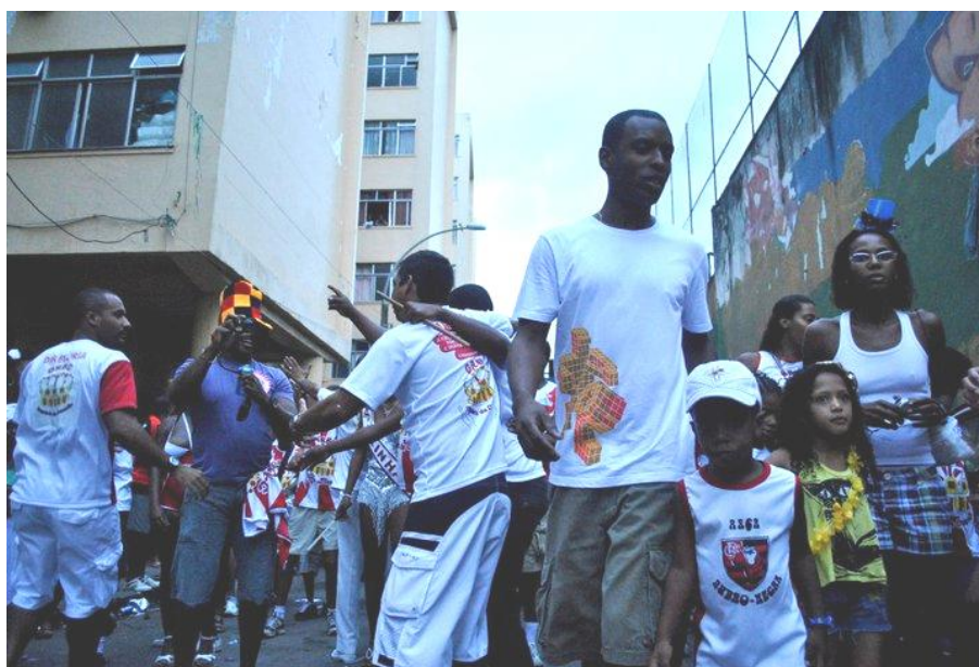
O desfile do bloco Império da Cruzada em março 2011. 53 .

“Incrível, extraordinário, estou bolado com a situação: se ordem ou desordem nesta cambuca não vou por a mão rapadura é doce, choque de ordem não é mole não... bala, bala, chiclete que emoção sou ambulante no calçadão. bala, bala chiclete e’ o baleiro bis reliquia no meu Rio de Janeiro” 52