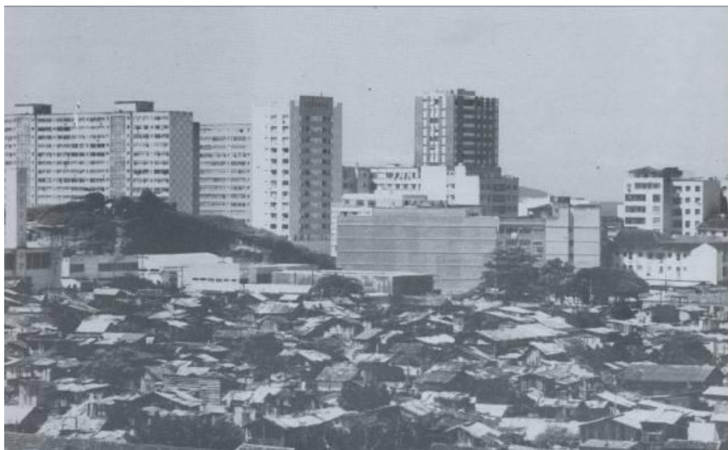
Favela da Praia do Pinto, c. 1960.

A próxima imagem mostra a favela da Praia do Pinto totalmente cercada pela cidade que crescera ao seu redor, e dá uma impressão sufocante de cidadela sitiada. Prédios cresceram por todos os lados, a vista das montanhas não pode mais ser apreciada pelas janelas dos barracos. O ar de cidade do interior deu lugar a uma cidade moderna e urbanizada, com o seu caos e barulhos típicos da modernidade, porém esta urbanização não cruzou o muro invisível que separa a cidade da favela. A favela ficou de fora dos planos de urbanização do Rio de Janeiro.