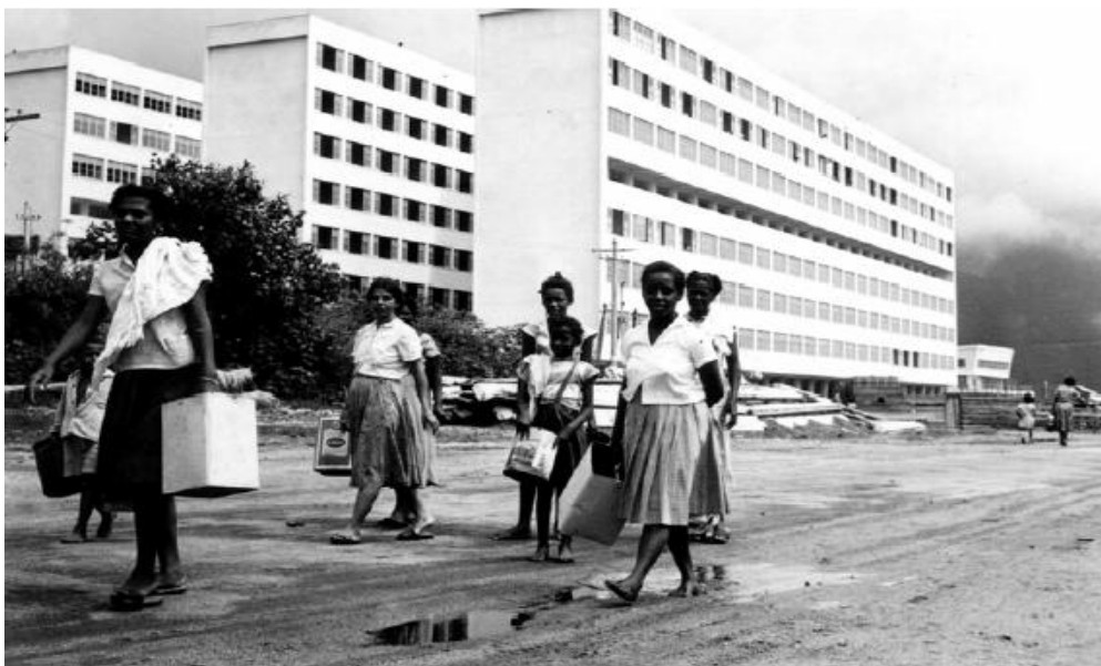
Mulheres da Praia do Pinto com latas d'água passam em frente aos prédios da Cruzada São Sebastião ainda em construção. Agência O Globo, c. 1960. Disponível no acervo do Núcleo de Memória da PUC-Rio.

Apesar de ser significativa a ausência de representantes do Estado nas fotografias da construção da Cruzada, o Presidente da República João Fernandes Café Filho, apoiou o projeto. Porém, a construção da Cruzada São Sebastião foi considerada uma vitória de Dom Helder Camara, visto que mesmo quase sem o apoio do governo e da igreja conseguiu levar adiante seu projeto.