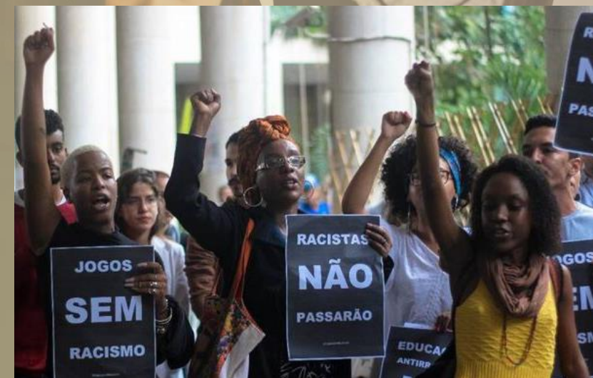
Manifestação na PUC-Rio contra os episódios de racismo ocorridos nos Jogos Jurídicos Estaduais. 2018.