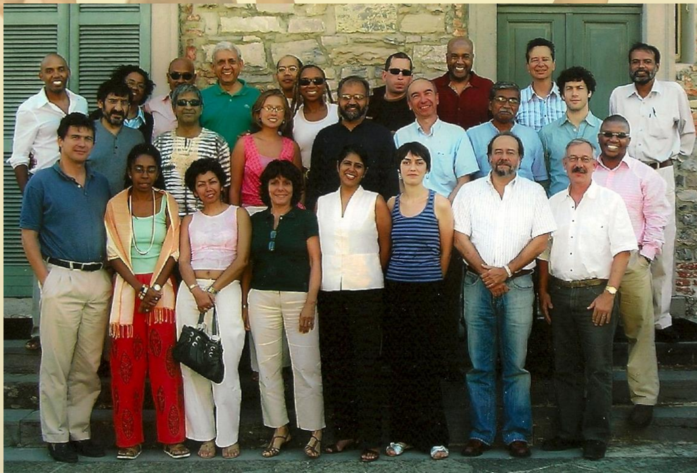
Conferencistas da Conferência de Bellagio. 2007.

Núcleo de Memória da PUC-Rio: nucleodememoria@puc-rio.br Edson de Souza: edson.de.souza@outlook.com