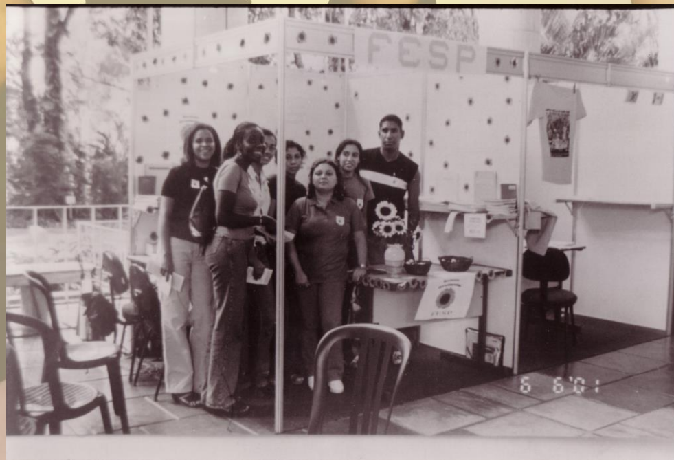
Alunos bolsistas do PVNC em estande do FESP na VI Festival de Valores da Universidade Católica. 2001.