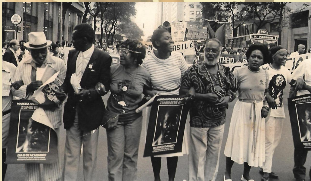
Marcha Zumbi está vivo realizada no Rio de Janeiro. Ao centro Lélia Gonzalez, Benedita da Silva e Abdias Nascimento. 1983.